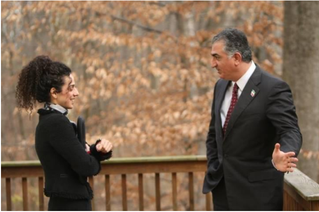
عکس (۱) دیدار علی نژاد با رضا پهلوی

علی نژاد به عنوان صدای سرکوب‌شدگان بخشی از جامعه‌ی مدنی ایران که معتقد است سیاست‌های جمهوری اسلامی در قبال حقوق بشر و حقوق شهروندی و حقوق زنان همیشه ثابت بوده است به ملاقات نماینده‌ی یک دولت سراپا ضدّ زن می‌رود که رئیس آن دسترسی زنان به خدمات پیش‌گیری از بارداری را به طرز بی‌سابقه‌ای محدود کرده است. او صراحتاً اعلام می‌کند که از نظر سیاسی جمهوری خواه و خواهان گذار و تغییر نظام از جمهوری اسلامی به یک حکومت دموکراتیک و سکولار است . ۴ حالا باید مشخصاً از مؤسس کمپین‌های به اصطلاح غیرسیاسی آزادی‌های یواشکی و چهارشنبه‌های سفید به عنوان دو جریان مدعی دفاع از حقوق زنان پرسید که چه سویی رهایی‌بخشی در مواضع راست‌گرایانه‌ی دولت وقت ایالات متحده نسبت به مسئله‌ی زنان دیده